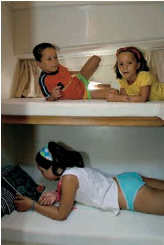
Deuxième cabine bâbord avec 2 lits superposés.

La ST-30 dispose d'intérieurs pratiques et fonctionnels, adaptés aux besoins du programme de navigation d'un grand cruiser, permettant la vie à bord aisément.