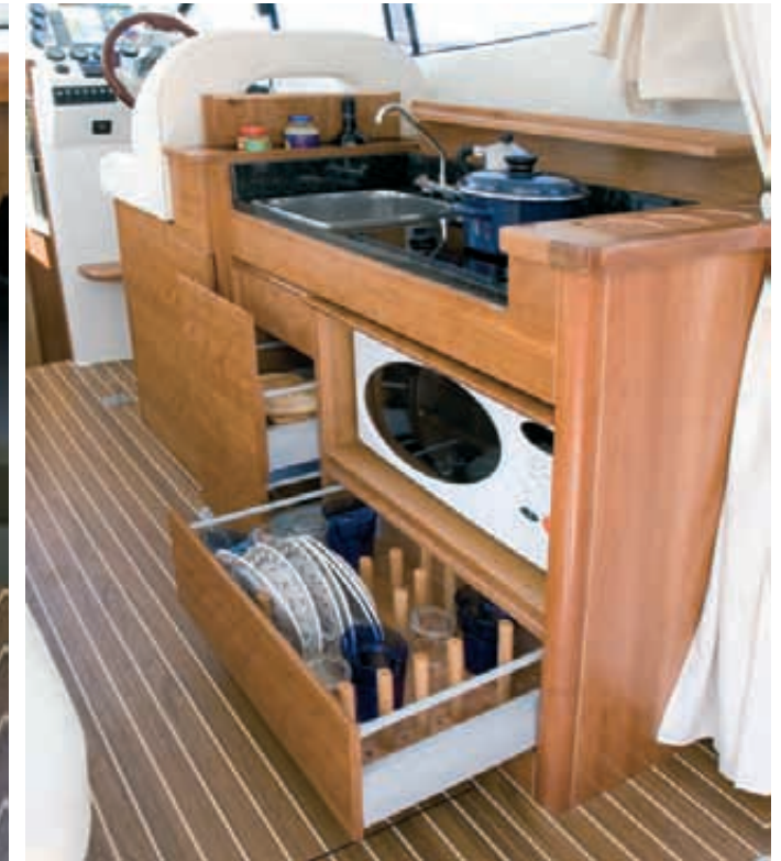
Meuble cuisine en bois massif, remarquable par son design et capacité ; il inclut le micro-ondes, le frigo et l'eau chaude.