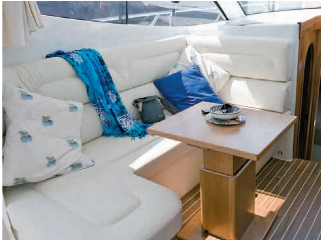
La dînette permet la vie à bord grâce à son confortable sofa en L (convertible) et la table centrale.