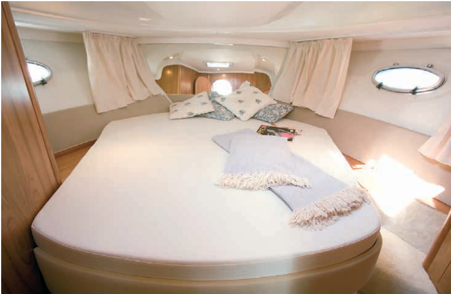
La cabine du propriétaire, spacieuse, possède une grande luminosité que lui apportent les deux hublots et le panneau ouvrant, un grand lit, penderie et rangements.