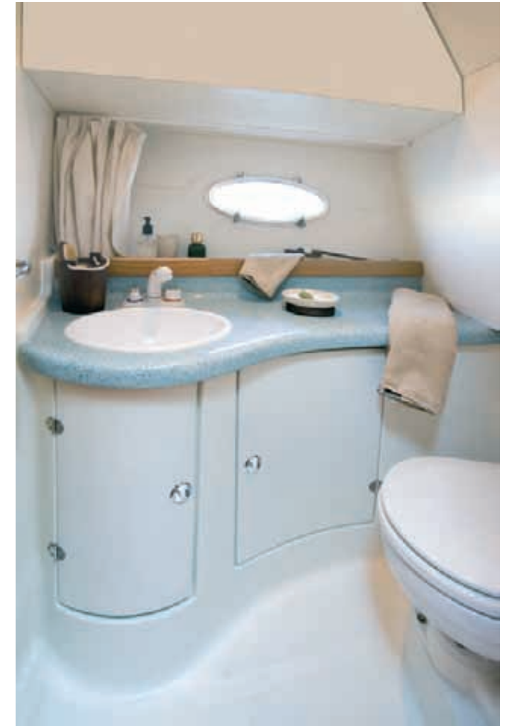
Grande salle de bain avec WC, qui dispose de douche avec eau chaude et froide, rangements et hublot pour ventilation.