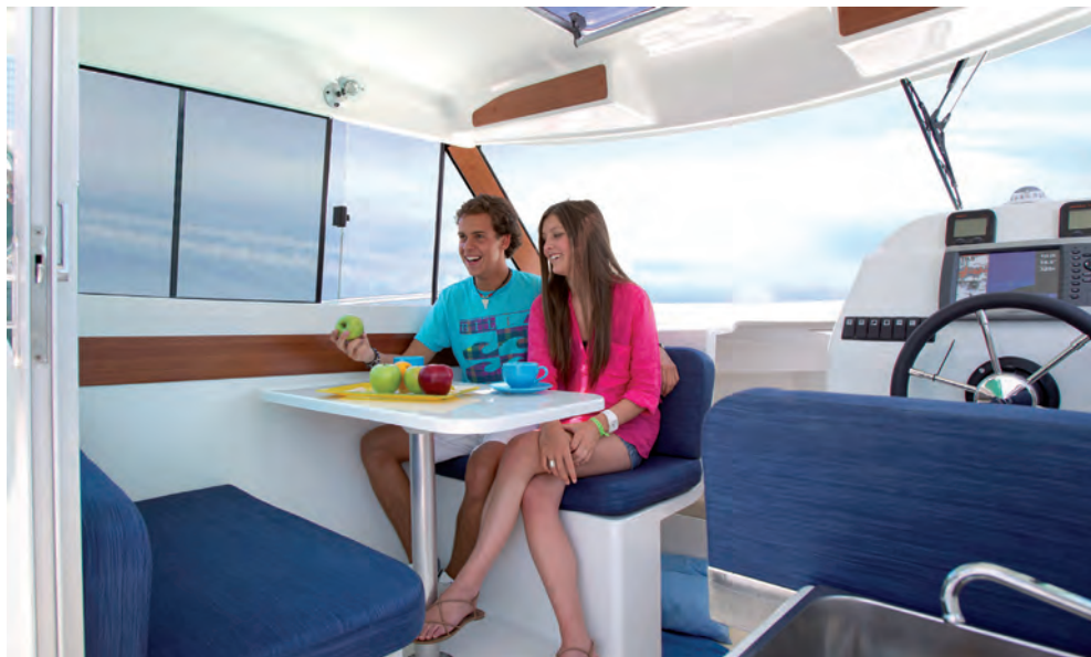
La dinette permet de recevoir 4 personnes confortablement. La parfaite aération est assurée par des vitres latérales coulissantes.