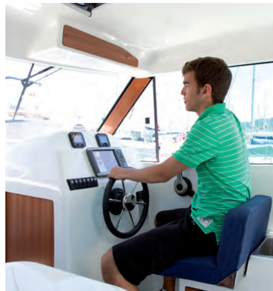
Le poste de pilotage situé à tribord, dispose d'un confortable siège pilote rabattable.