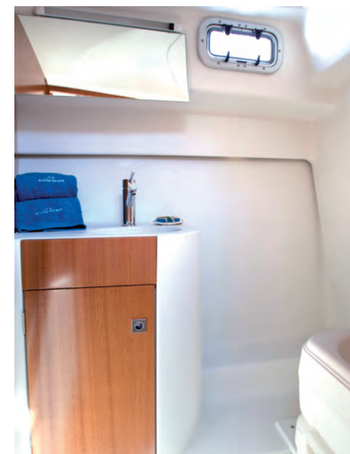
Quatre personnes peuvent passer la nuit à bord grâce au lit double situé dans la cabine avant, au couchage bâbord de 2,00 x 0,80 mts et à la dinette transformable. Une salle d'eau séparée d'une hauteur de 1,75 m sous barrot se trouve à tribord.