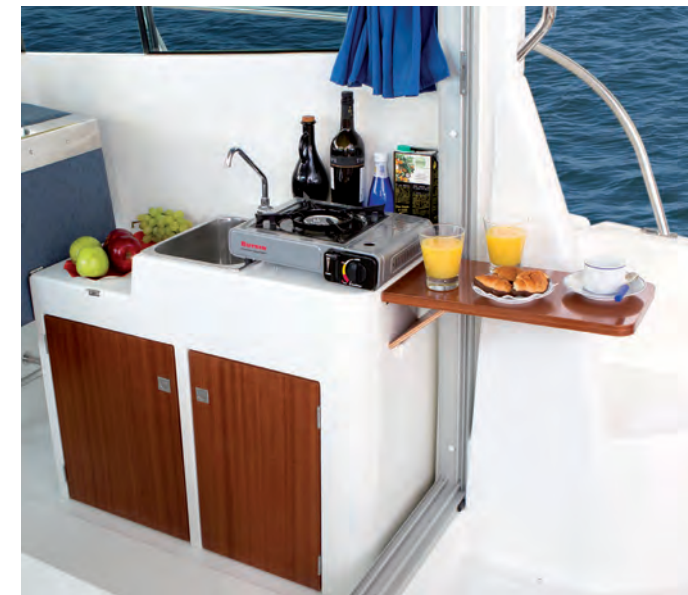
Meuble cuisine avec évier et table pliable.